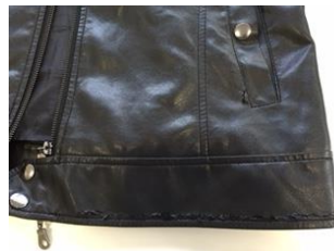
劣化した合成皮革のジャケット

(注) 3~5年という年数は個体差や使用・保管状況により異なります。目安として3年以内はクリーニングしても全く問題はありませんので安心して下さい。劣化が始まる前の段階でも少しでも長持ちさせる為の加工、又は3年以上経過した製品でも特殊クリーニングで対応可能な場合もありますので一度ご相談下さい。